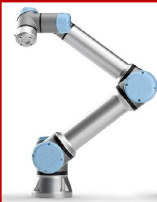
Intégrateur COBOT UR